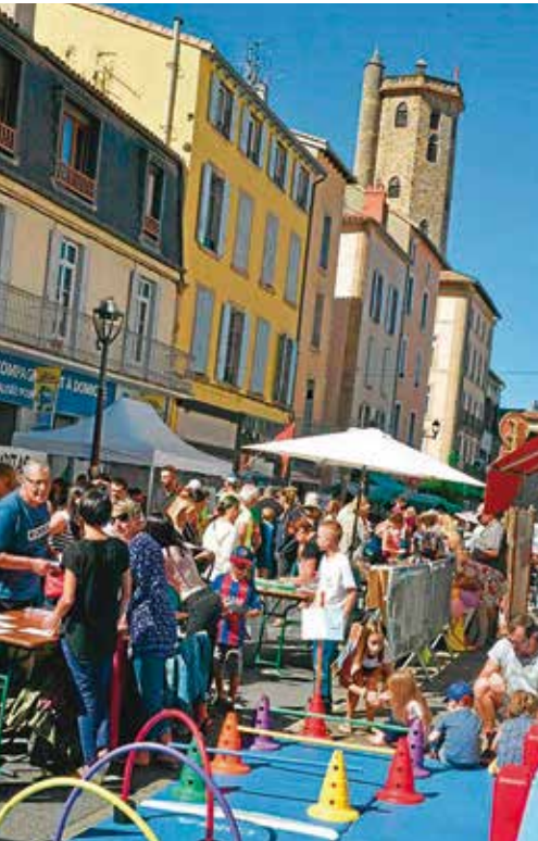
Le forum des associations s'est déroulé le 7 septembre à Millau.